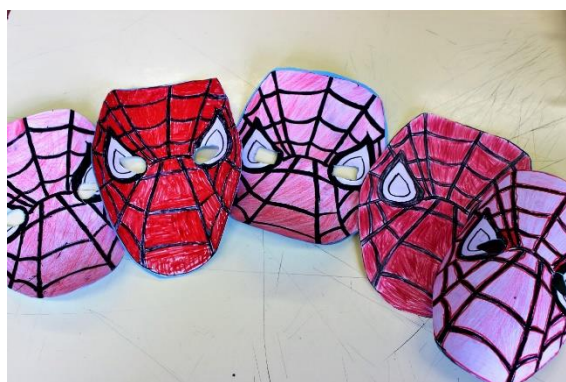
Máscaras escolhidas pelos rapazes

Desenharam, pintaram, recortaram máscaras escolhidas por eles, lancharam em grupo na sala e degustaram um bolo oferecido por uma encarregada de educação à qual, desde já, agradecemos.